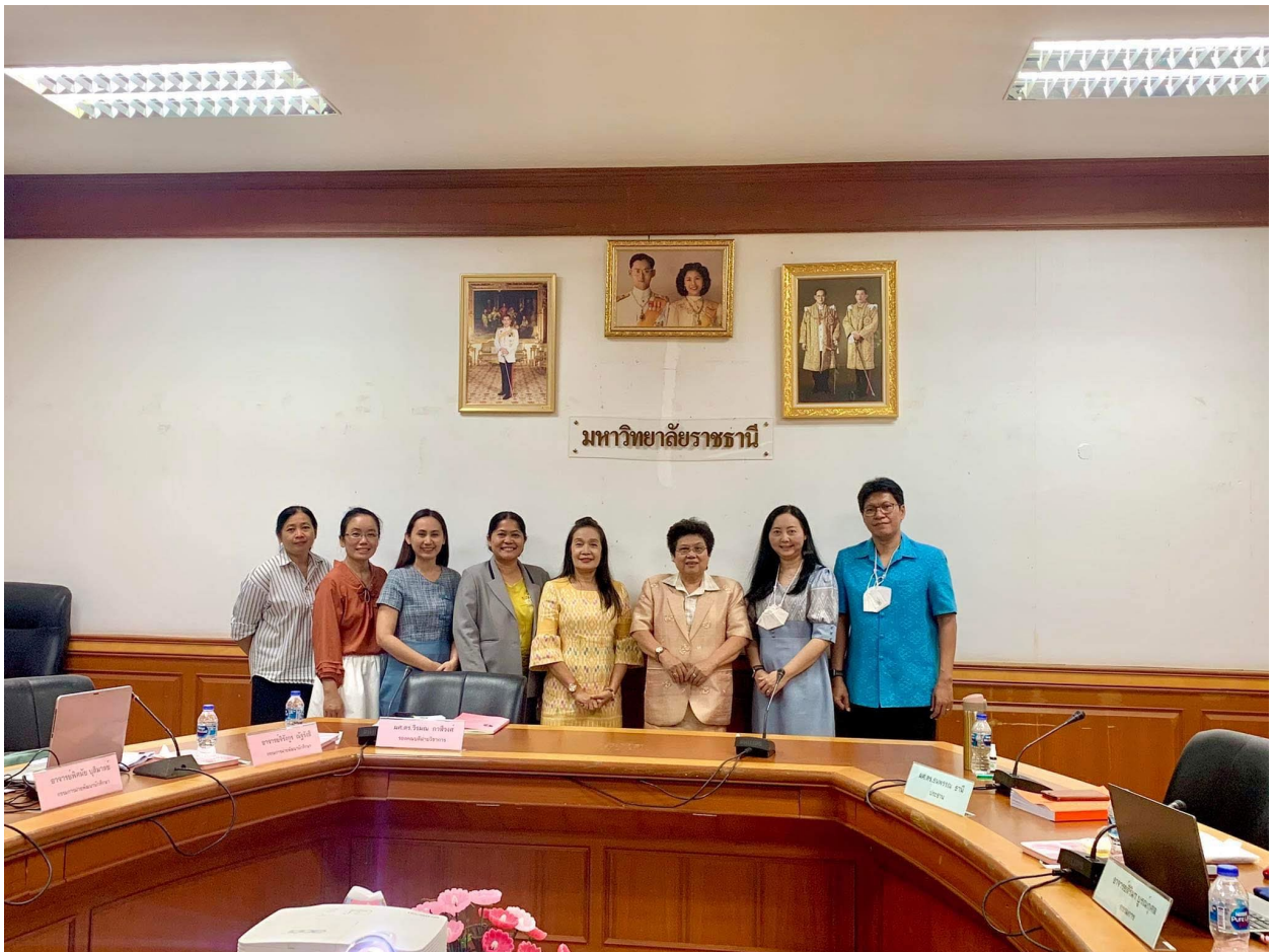
รายงานผลการประเมินคุณภาพภายใน ปีการศึกษา 2565 คณะพยาบาลศาสตร์ มหาวิทยาลัยราชธานี